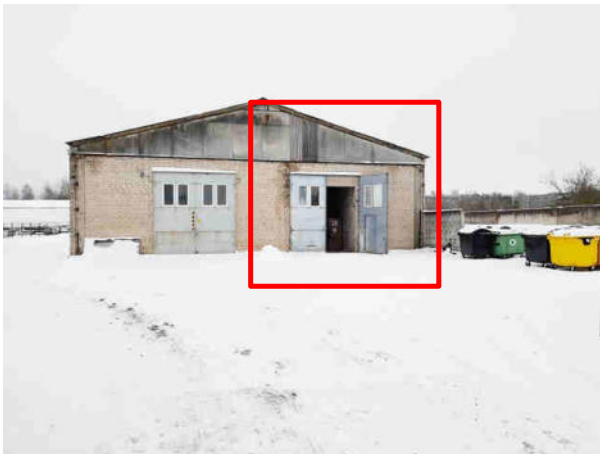
Skats uz noliktavas ēku (kad.apz.004), kurā atrodas vērtējamās telpas