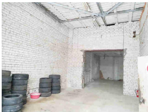
Noliktavas ēkas ar kad.apz. 0500 009 0801 004 telpu grupas (kad.apz.002) noliktavas telpa Nr.2